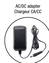
AC/DC adapter Chargeur CA/CC