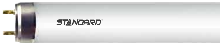
Longueur nominale : 48 po (915 mm) Dia. : 1 po (26 mm)

Code de commande : 56503 Description: F30T8/841HL/ES/STD Code CUP : 69549565036 Quantité par caisse : 25