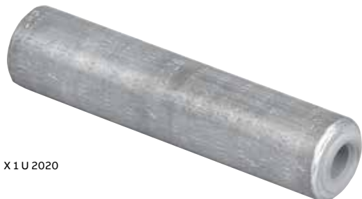
X 1 U 2020

Épissures non isolées en aluminium (à compression) – Matrices de la Série 840