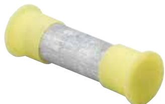
U 1 B 1010 EC

Épissures à compression en aluminium pour entrées de service – Matrices 5/8 po de séries U 1 B MC et CS MC