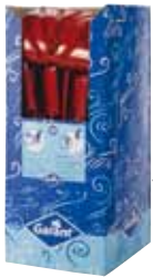
Boîte-présentoir, format 1/4 de palette.